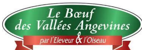
Logo de la marque « Le Bœuf des Vallées Angevines »

EVA est une association Loi 1901 créée en 2001 et réunissant une dizaine d'éleveurs de viande bovine à sa création ; elle en compte 13 aujourd'hui. L'objectif est le développement d'une marque de viande valorisant le territoire des Basses Vallées Angevines ainsi que le savoir-faire des éleveurs avec la mise en place de pratiques vertueuses pour l'environnement : « Le Bœuf des Vallées Angevines » anciennement « L'éleveur et l'oiseau ». La mise en place de cette marque permet une commercialisation à l'échelle locale de la viande bovine.