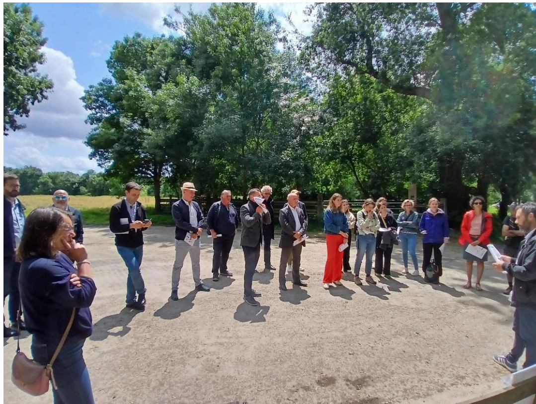
Rencontre régionale du 6 juin 2025 à Angers

La rencontre régionale Grand Ouest, à Angers, du 6 juin 2025, s'inscrit dans la programmation (2022 – 2027) de Terres en villes en tant qu'ONVAR.