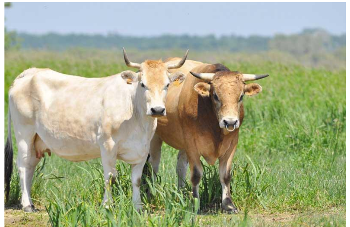
Les vaches nantaises

La vache nantaise est une race emblématique de la région nantaise [Loire-Atlantique, Ouest Maine et Loire, Sud Bretagne]. Rustique et mixte, elle fut mise à l'écart dans l'après-guerre passant de 150 000 têtes à moins d'une centaine