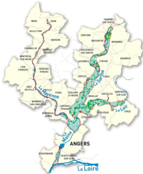
Carte des basses vallées angevines

EVA est une association Loi 1901 créée en 2001 et réunissant une dizaine d'éleveurs de viande bovine à sa création ; elle en compte 13 aujourd'hui. L'objectif est le développement d'une marque de viande valorisant le territoire des Basses Vallées Angevines ainsi que le savoir-faire des éleveurs avec la mise en place de pratiques vertueuses pour l'environnement : « Le Bœuf des Vallées Angevines » anciennement « L'éleveur et l'oiseau ». La mise en place de cette marque permet une commercialisation à l'échelle locale de la viande bovine.