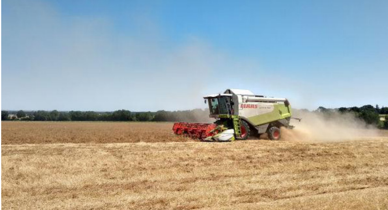
Récolte de lentilles