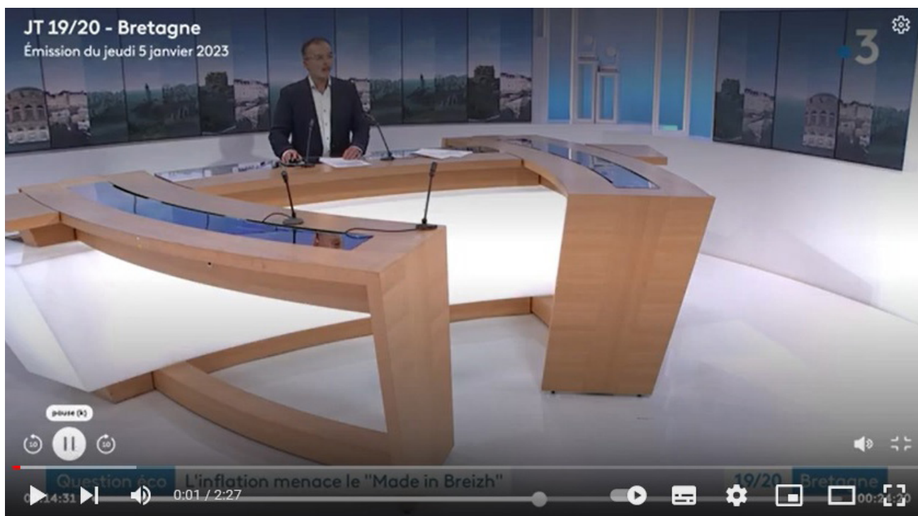
Communication sur les filières légumineuses lors du Journal Télévisé du 5 janvier 2023